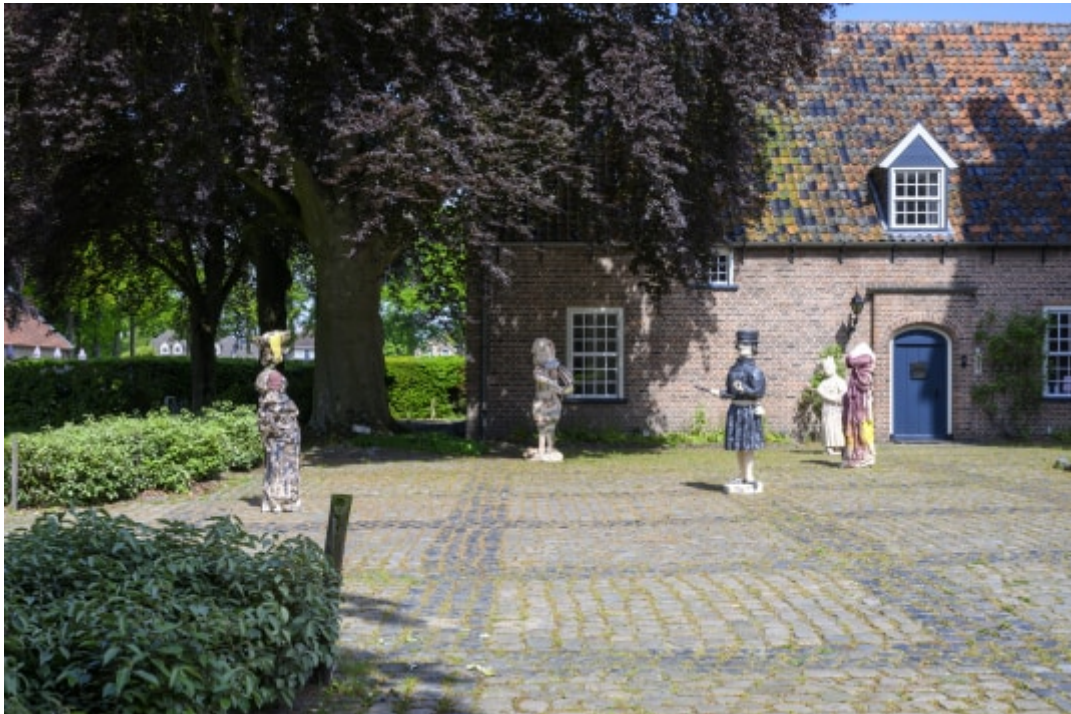
Folkert de Jong, Pleurants, 2023, foto Peter Cox

De kloosters van de Heilige Driehoek in het Noord-Brabantse Oosterhout vormden van 3 juni t/m 16 juli het bijzondere toneel voor een hedendaagse kunstbiennale van internationale allure. In zes weken tijd ontving de derde editie van de h3h biennale ruim 20.500 bezoekers. De tweede editie van de biennale in 2021 trok 22.500 bezoekers.